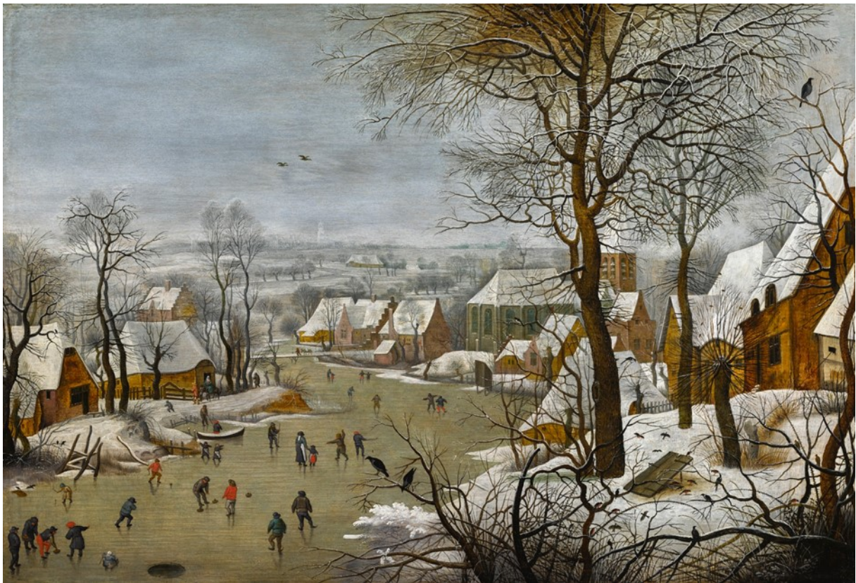
" Paysage d'hiver avec patineurs " de Pieter Brueghel Le jeune 1601